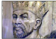
امیر تیمور لنگ